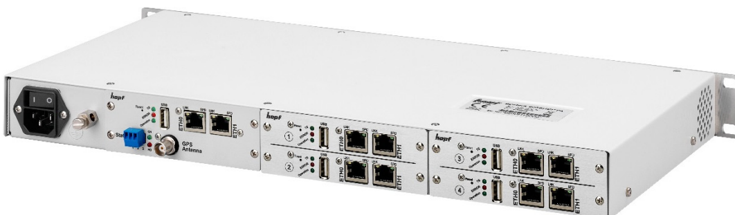
Rückansicht Basissystem 8030HEPTA/GPS mit Erweiterung durch 4 zusätzliche, vollständig voneinander unabhängige Netzwerkzeitserver Module 8030NTS/M