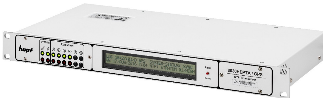
Frontansicht 8030HEPTA/GPS mit Status-LEDs und LCD Display

Die freischaltbaren Funktionen können nach dem Systemkauf vor Ort durch Eingabe eines seriennummernbezogenen Aktivierungsschlüssels pro Netzwerkzeitserver Modul aktiviert werden, auf dem die jeweilige Zusatzfunktion benötigt wird.