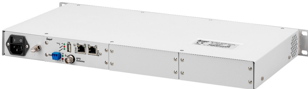
Rückansicht Basissystem 8030HEPTA/GPS mit 2 Ethernet-Schnittstellen 10/100/1000 Mbit/s autosensing, 1 USB-Port und Status-LEDs

Der Netzwerkzeitserver 8030HEPTA/GPS ist perfekt für alle, die eine platzsparende, flexible und kostengünstige Lösung mit zahlreichen Konfigurations- und Erweiterungsmöglichkeiten benötigen.